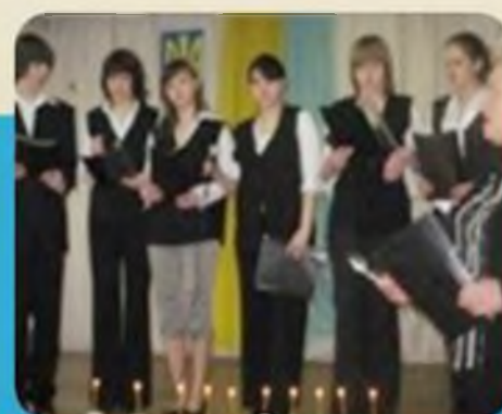
Департамент культури і дозвілля