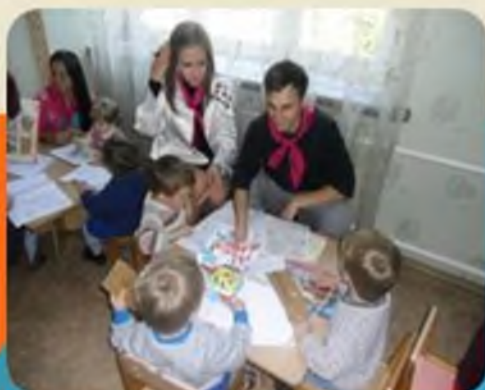
Департамент “ Милосердя”