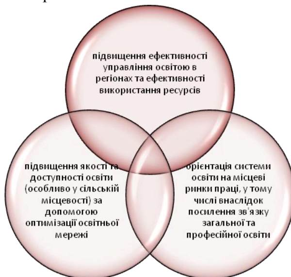
Рис. 2. Основні завдання, які вирішуються в рамках створення округу

Ідея створення освітніх округів себе в цілому виправдала. Це підвищило керованість, допомогло заощадити значні кошти за рахунок оптимізації ресурсів та реструктуризації мережі закладів (рис. 2). Існують певні недоробки, пов’язані з недостатньо налагодженою взаємодією засновників, плануванням, підготовкою фахівців, формуванням матеріально-технічної бази.