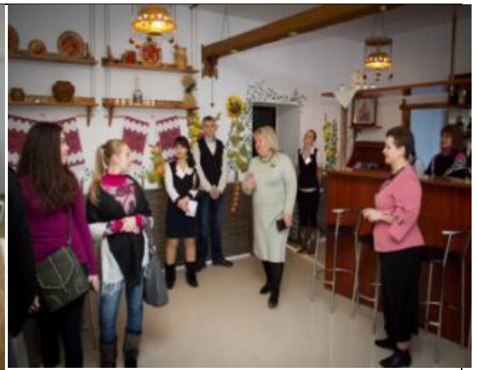
Екскурсія по закладу