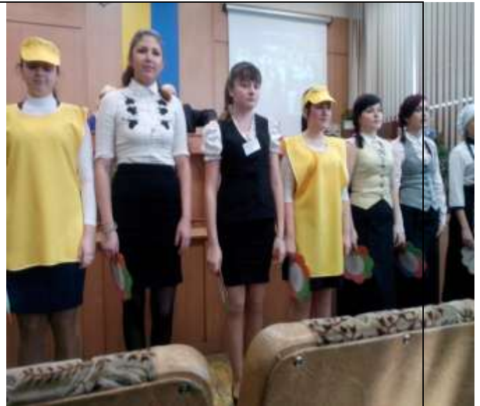
Виступ агітбригади в Дніпропетровському обласному інституті післядипломного навчання

Профорієнтаційна робота – це цілеспрямований і досить клопіткий процес, який не повинен мати ніяких хибних кроків, від цієї роботи залежить майбутнє молоді. А значить і її благополуччя – психологічного, соціального, матеріального, морального. Молодь повинна жити, працювати та відпочивати із задоволенням.