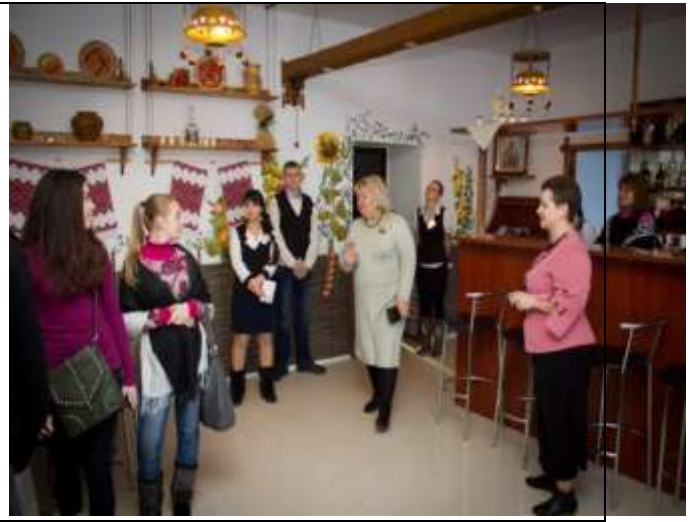
Екскурсія по закладу